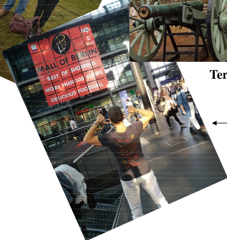
← Silvia a Berlino