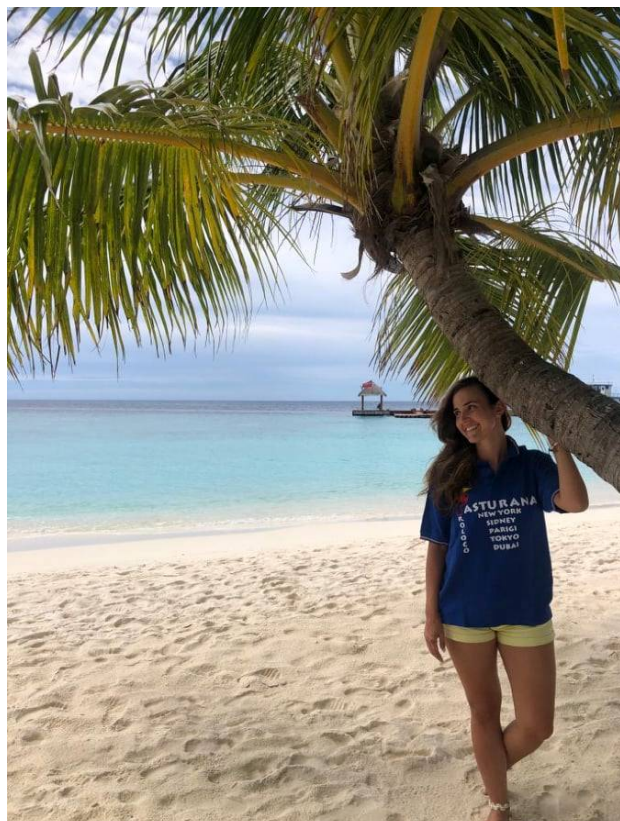
Gli Sposini a Dubai e alle Maldive →