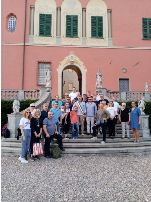
14 settembre Delegazione russa a Pasturana Associazione generale russo Sikatov a memoria della battaglia napoleonica di Novi Ligure.