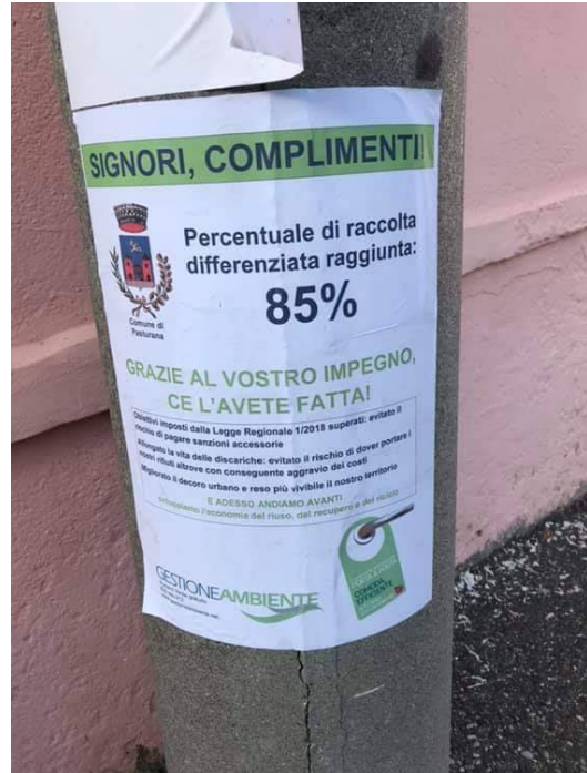
Con il nuovo sistema aumenta la percentuale di raccolta differenziata nel nostro Comune, che già aveva livelli alti.