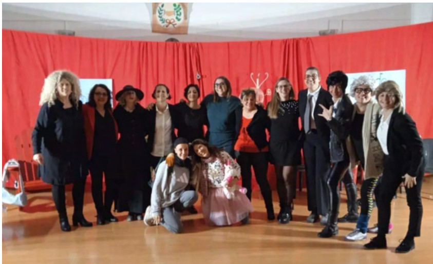
Sognatrici in "Mary Poppins"