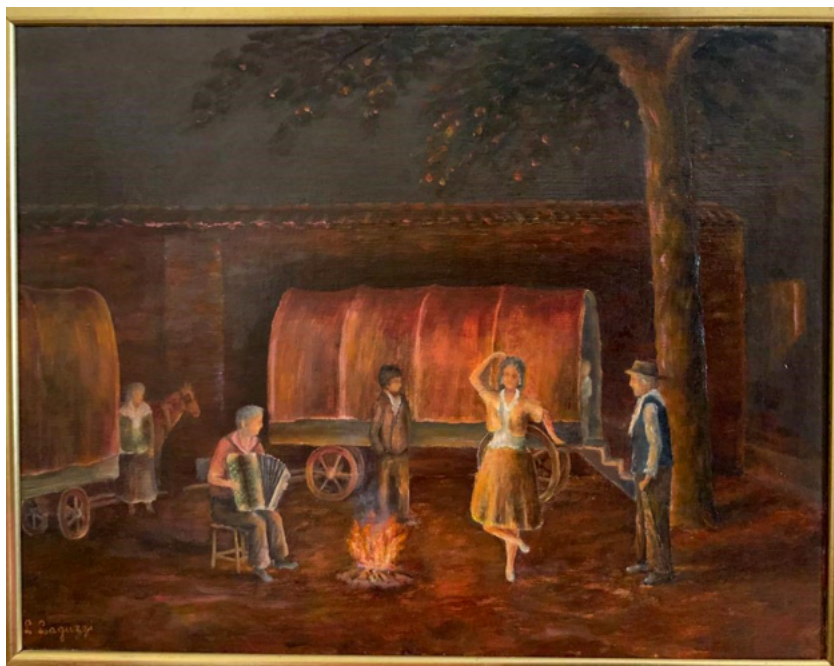
Lino Laguzzi "I gitani nella sarsera"

Il centro della vita sociale dei nostri antenati era l'odierna piazza Spinola, chiamata dai pasturanesi "a sarsera" per la presenza di numerosi salici detti "sorsi" in dialetto. "A sarsera" era anche ritrovo di svariati personaggi, che venivano in paese a lavorare qualche ora, fornendo piccoli servizi ai pasturanesi. La versione in dialetto è affiancata da quella in italiano, in modo da rendere comprensibile a tutti il testo. Qui a fianco, un quadro del pittore locale Lino Laguzzi, che ritrae "a sarsera" com'era, sullo sfondo il muro di cinta che delimitava la proprietà privata detta "il giardino", i bei platani in ricordo dei caduti pasturanesi e i "gitani" accampati attorno ad uno scoppiettante fuoco. Ecco quindi "i ricordi d'ina nostra socia".