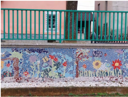
Il murales nei giardini pubblici