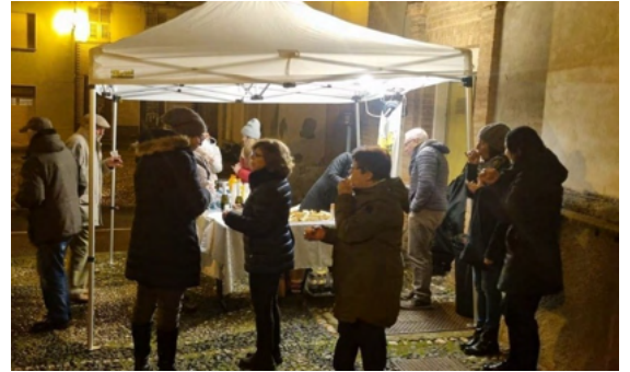
Vin brulè, cioccolata calda e panettone