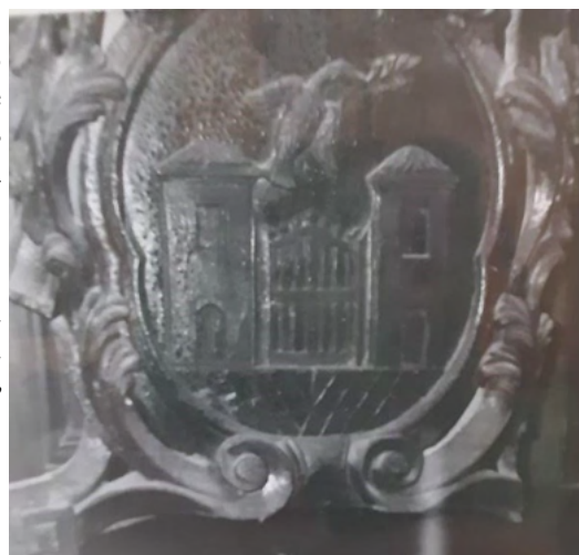
Lo stemma dell'Arciprete Bianchi

Nella parte a nord, attigua al campanile, si aprono i due ingressi (mediato ed immediato) al campanile stesso: (quello mediato conduce anche sul pulpito): nello spazio tra questi due ingressi vi è un altro stretto armadio nello stesso stile del precedente: è sormontato da una targa o cimasa su cui è scolpito uno stemma: sotto di questa targa è scolpito: 1788 Archip. Bianchi.