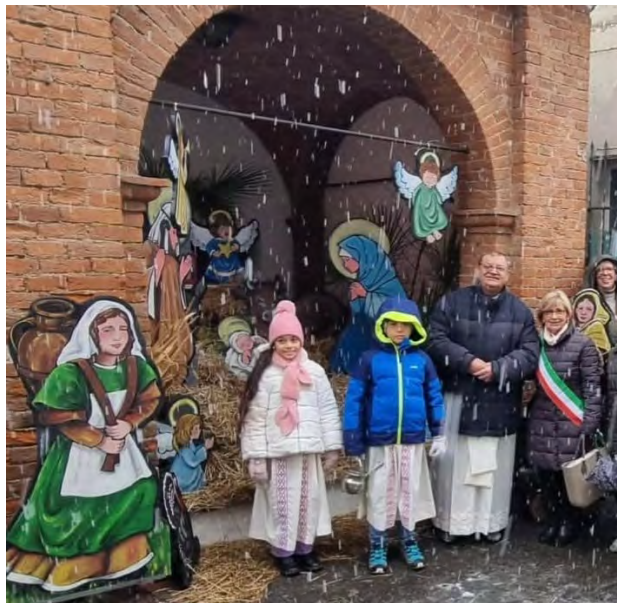
Don Giovanni alla benedizione del Presepe diffuso

Vorrei che il mio augurio e questa certezza del “Dio vicino” raggiungessero tutte le persone che in questi giorni non possono venire nelle nostre comunità, non possono partecipare alla gioia della festa insieme perché malate, anziane o impedita per altre ragioni, e vorrei che questa certezza della fedeltà del Signore Gesù arrivasse con particolare simpatia e affetto – come balsamo che allevia le ferite – a quanti vivono situazioni di disagio, dolore, oppressione e difficoltà.